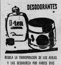
REGULA LA TRANSPIRACION DE LAS AXILAS Y LAS DESODORIZA POR VARIOS DIAS

Señaló la facilidad con la que los modelos actuales pueden ser limpiados, el perfecto aislamiento que no solamente mantiene el frío sino que también evita que ingresen malos olores y "hasta los más pequeños insectos, tales como las hormigas que algunas veces ingresan a las cocinas."